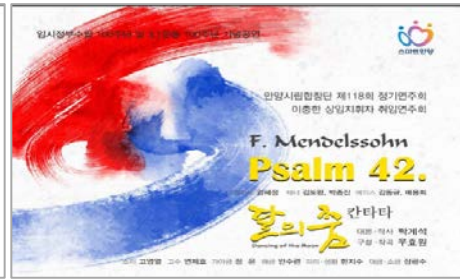
(3부) 달의 춤