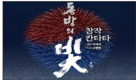
(1부) 동방의 빛