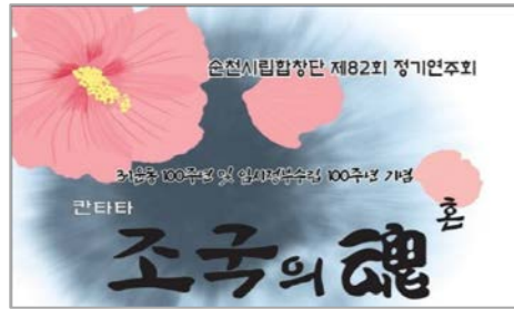
(2부) 조국의 혼